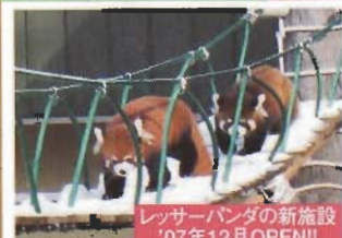
レッサーパンダの新施設 '07年12月OPEN!!