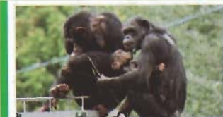
チンパンジーの森