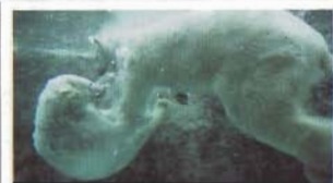
ほっきょくぐま館

地球上に棲むさまざまな生物。 空、地、水、夜、それぞれ得意のフィールドをもち 天性の「生きる力」を駆使し 時には美しく、時にはユーモラスにも見える仕草をして 今日も命いっぱい生きています。