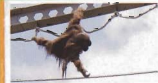
おらんうーたん館