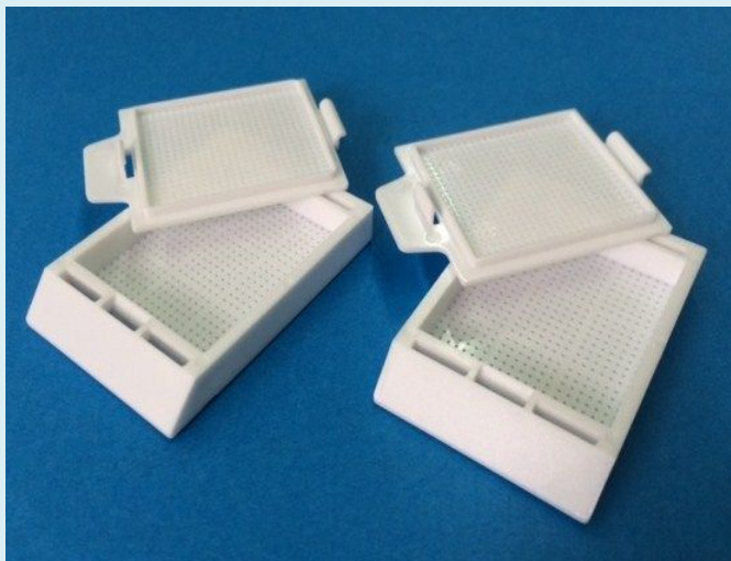
バイオディッシュ N 1分画