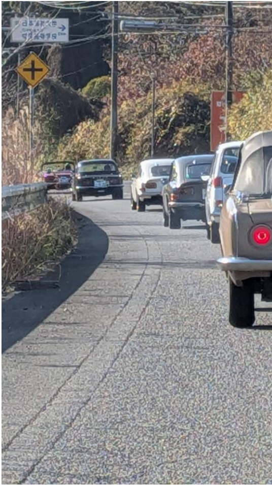
南知多のカントリーロードに行く。