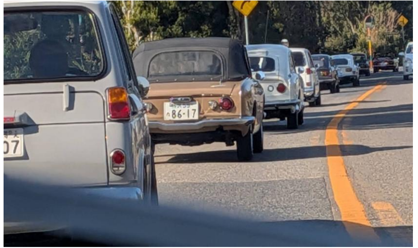
三河湾が見えてくる。