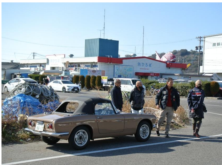
新会員 I さんの、カフェオレ色の S600