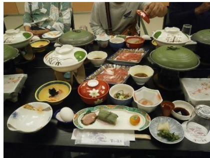
喜びの宿高松の夕食