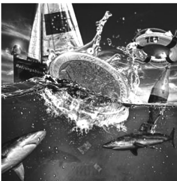
▲海に沈みつつあるユーロ通貨