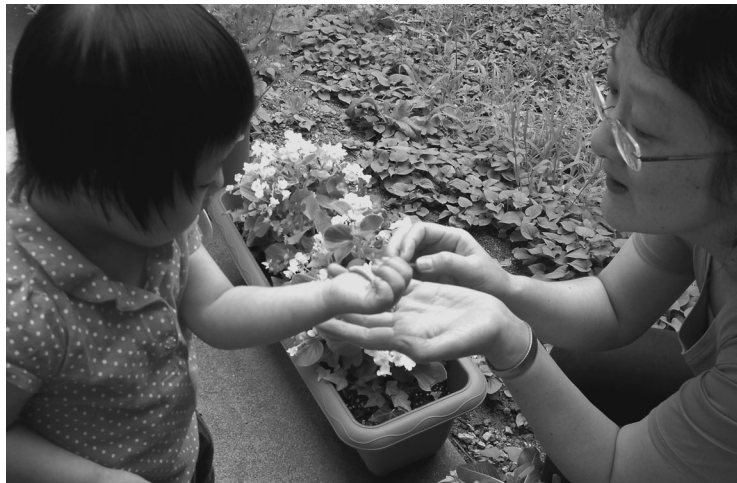
富坂子どもの家、園庭での活動から