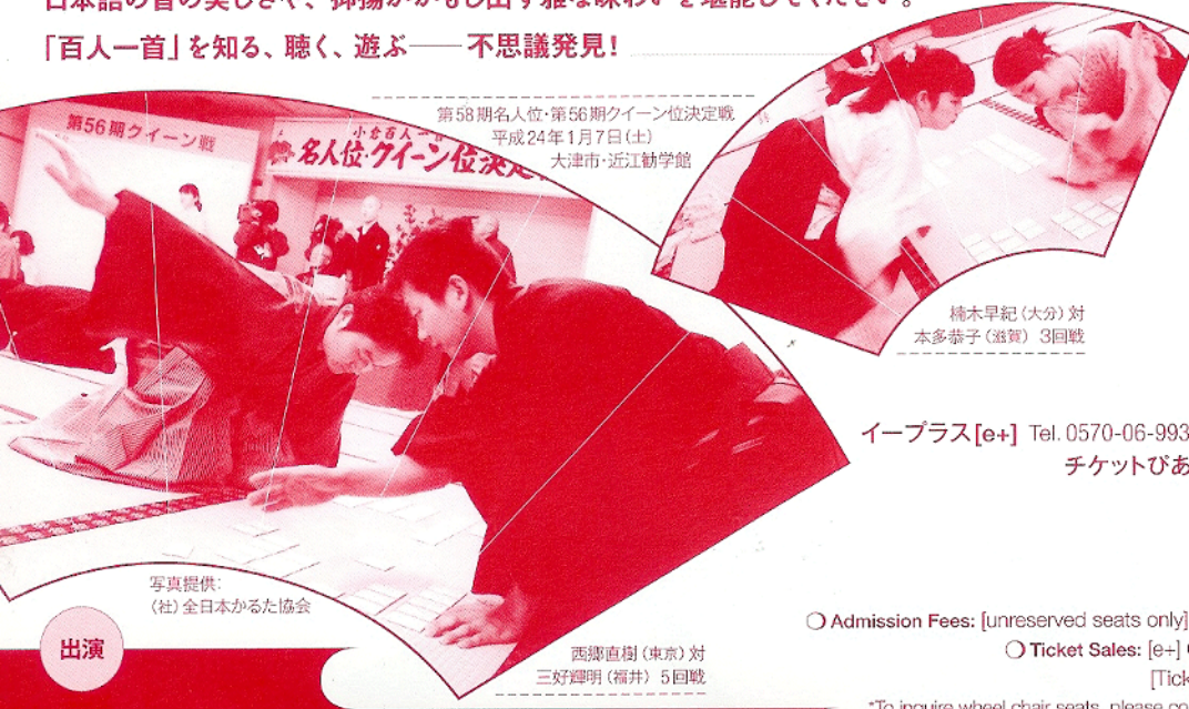
第58期名人位・第56期クイン位決定戦 平成24年1月7日(土) 大津市・近江勸学館