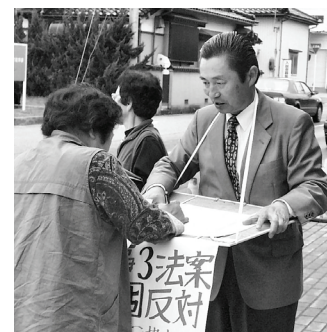
署名運動に取り組む砂田市議