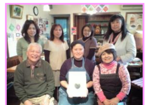
スタッフの皆さんと

またその笑顔に会えますように。(今後の研修予定: 2012年4月3(火)、4(水)、6(金))