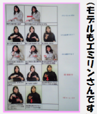
(モデルもエミリンさんです)