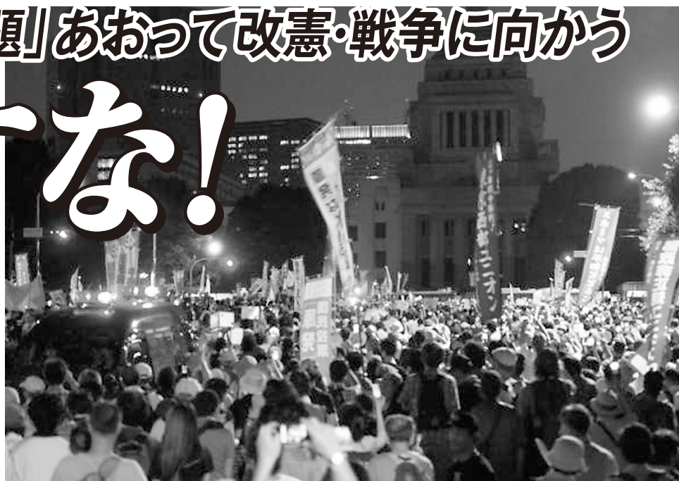
原発再稼働反対の「国会包囲行動」が呼びかけられた7月29日（日）、国会正門の道路は労働者市民の怒りで埋め尽くされた。6.29首相官邸前に「20万」の人波が押し寄せ、17万人結集の7.16「さようなら原発10万人集会」に続いての大規模な抗議闘争となった

「領土問題」があちこちで激化している根本原因は、世界大恐慌が進展し、各国の経済的・政治的危機が著しく高まり、その国内的危機を対外的に転嫁