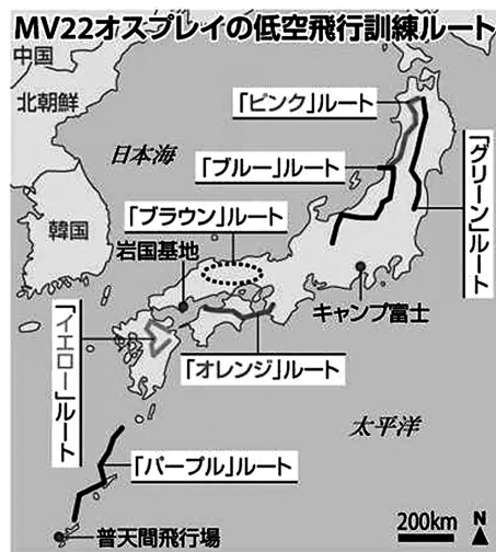
公開されているだけでもこれだけの全国展開。中国地方を横断する「ブラウンルート」も存在することが明らかになった

〒101-0061 東京都千代田区三崎町 2-20-7-303 tel.fax.03-5211-5415 million@mqc.biglobe.ne.jp http://million.at.webry.info/