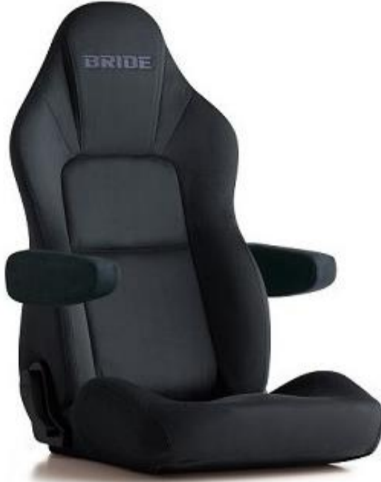
アームレスト1本+シートレール付