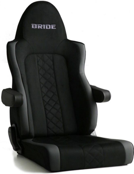
アームレスト2本+シートレール付